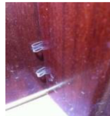
PLÁSTICOS PEQUEÑOS Pinzados entre el marco y la puerta

ESTOS MÉTODOS AVISAN AL DELINCUENTE DE QUE LA VIVIENDA ESTÁ SIN MORADORES