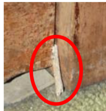
PALITOS DE MADERA Apoyados en la puerta